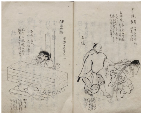
『刑罪大秘録』(法医学教室旧蔵)