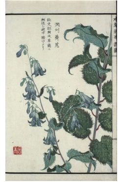
『本草通串證図』 (衛生学教室旧蔵)