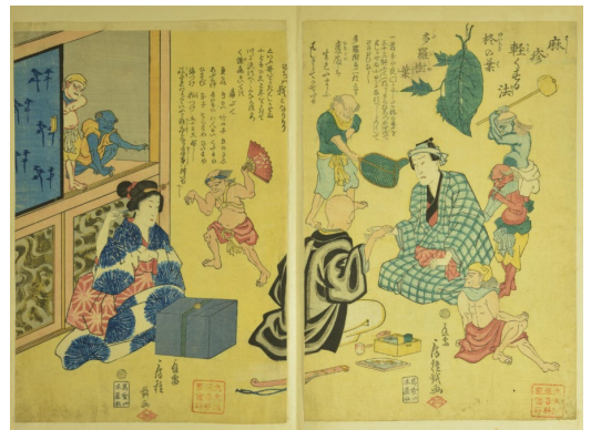
『麻疹軽くする法』(泌尿器科学教室旧蔵)