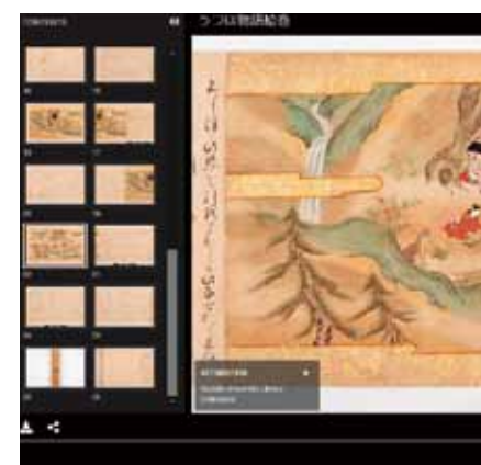
デジタル資料の閲覧画面