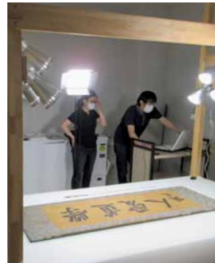
資料のデジタル化風景