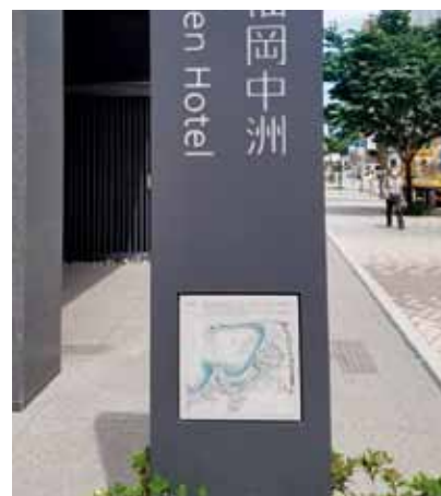
「福岡城下町・博多・近隣古図」の活用 (三井ガーデンホテル福岡中洲)

ご希望により、支援したい図書館を指定することや、デジタル化したい貴重書を選ぶことができるなど、あなたの思いを、支援の形につなぐことができます。公開されたデジタル化画像は、貴重資料デジタルアーカイブでご覧いただけます。画像は、一部を除き、無償で自由に利用するため、思いもよらぬところで、ご支援によりデジタル化された資料に出会うことがあるかもしれません。