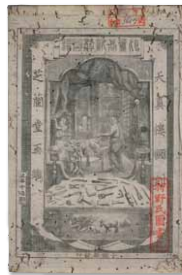
修復が必要な資料の例