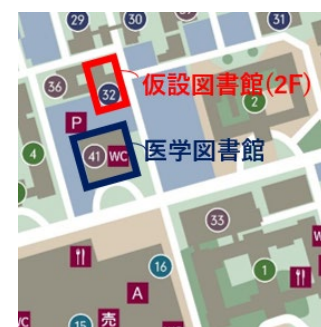
馬出キャンパスマップ

医学図書館は、主に医学・歯学・薬学・看護学とその近接領域の雑誌・専門書を所蔵します。そのうち仮設図書館には、医学図書館1Fの国試対策書を含む専門書約35,000冊を移設します。