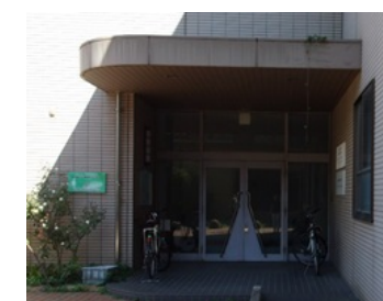
仮設図書館入口 (生体防御医学研究所4号館)