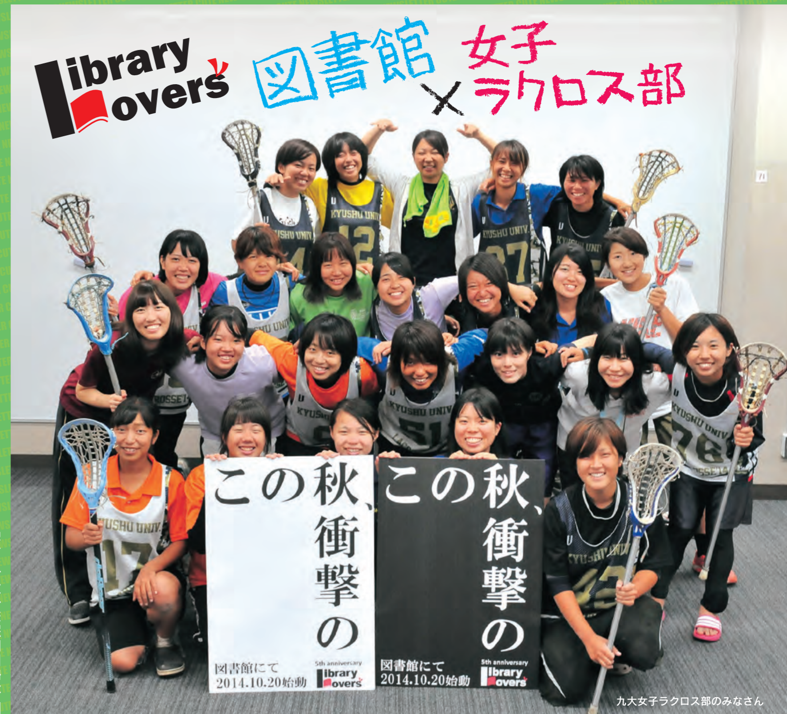
九大女子ラクロス部のみなさん