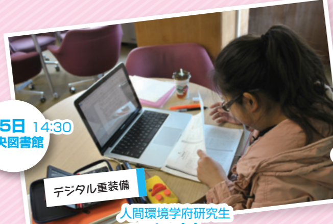
11月15日 14:30 中央図書館 「デジタル重装備」 人間環境学府研究生 skyさん (1) 来週の授業の発表 (2) パソコン、電子辞書 (3) さまざまな本が読めます