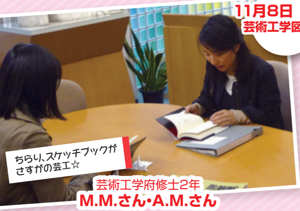
11月8日 16:30 芸術工学図書館 With ニコ倫☆ 「ちらい、スケッチブックがさるがの芸☆」 芸術工学府修士2年 M.M.さん・A.M.さん (1) 修士論文 (2) ペン・ノート (3) 雑誌