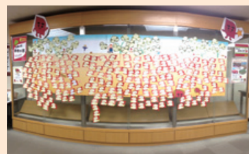
▲中央図書館の芋畑

昨年10月21日~11月17日、九州地区の大学図書館の合同で実施しました。今年の参加館合同企画「収穫の秋 読書の芋。」では、九州大学で248No.1の収穫量となりました! その他、本学独自企画として、本のリユース、ピリオパトル首都決戦2013九州大学予選会、音楽のタペ(SPLレコード鑑賞会)を行い、いずれも多くの方にご参加いただきました。 また、大学生協とのタイアップでお芋メニューを提供いただき、お腹も満たされた読書の秋となりました。