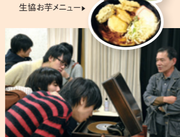
▲「音楽のタペ」の様子