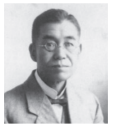
九州帝国大学医科大学教授 宮入 慶之助