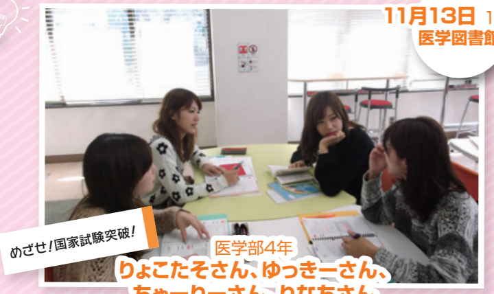
11月13日 11:00 医学図書館 「なぜせ/国家試験突破!」 医学部4年 りよこたさん、ゆっきーさん、チャーリーさん、りなちさん (1) 国家試験(看護師) (2) クエスチョンバンク、レビューブック、赤シート、蛍光ペン etc. (3) 友達に会える/ラウンジでおしゃべり。憧れの先輩を拝むこと!