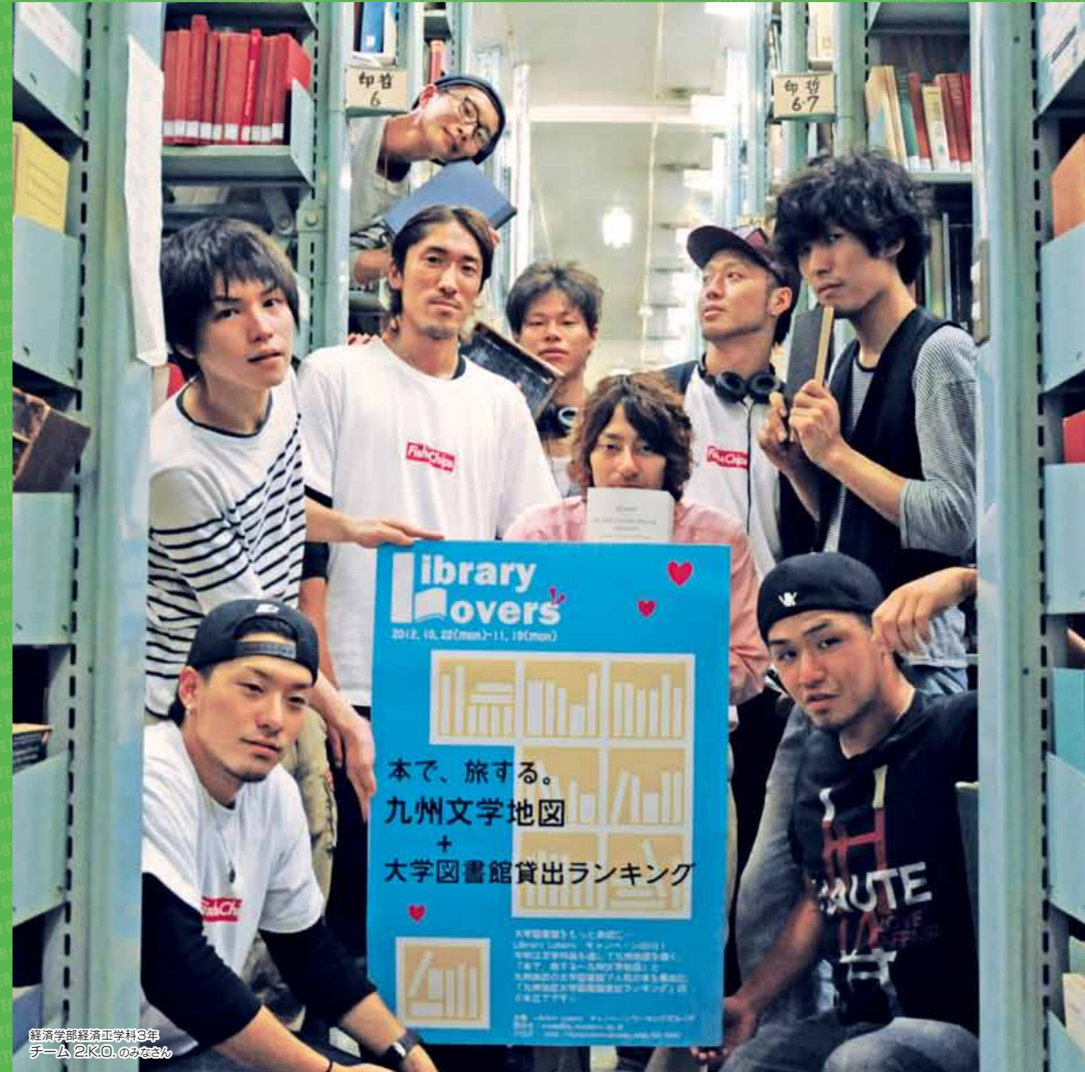
経済学部経済工学科3年 チーム 2.KO.のみさん

発行:九州大学附属図書館 TEL 092-642-2533 URL http://www.lib.kyushu-u.ac.jp/