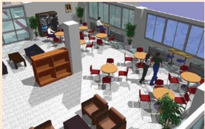
イメージですので、実際とは多少異なる場合があります

室内にはテーブルやカウンターなどの他、自動販売機(飲み物のみ)を設置し、飲食をしながらの休憩、気分転換ができる空間を提供いたします。どうぞ、お楽しみに。