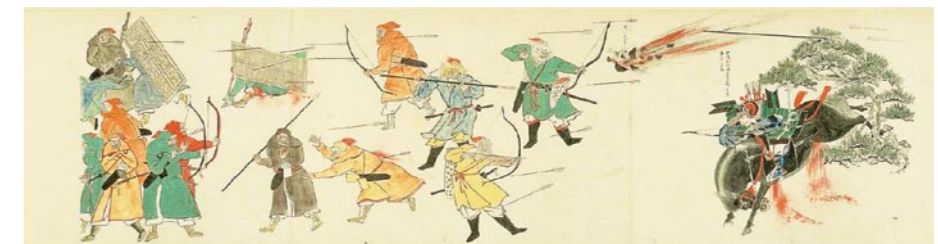
『蒙古襲来絵詞』(中央図書館所蔵)

問合せ先: 九州大学附属図書館利用支援課サービス企画係 TEL:092-642-2533 e-mail: circ2@lib.kyushu-u.ac.jp