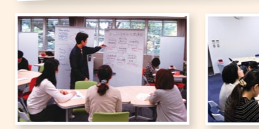
↑きゅうと commons (中央図書館) ↑オープンセミナー室(伊都図書館) みんなでグループワークやディスカッションに。