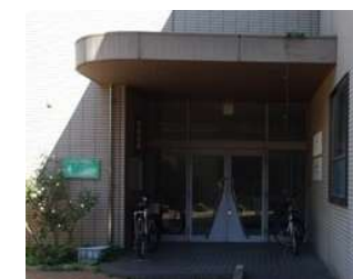
仮設図書館入口 (生体防御医学研究所4号館)