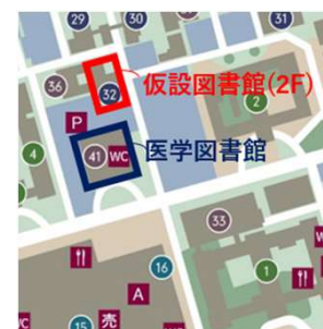
馬出キャンパスマップ

医学図書館は、主に医学・歯学・薬学・看護学とその近接領域の雑誌・専門書を所蔵します。そのうち仮設図書館には、医学図書館1Fの国試対策書を含む専門書を移設します。